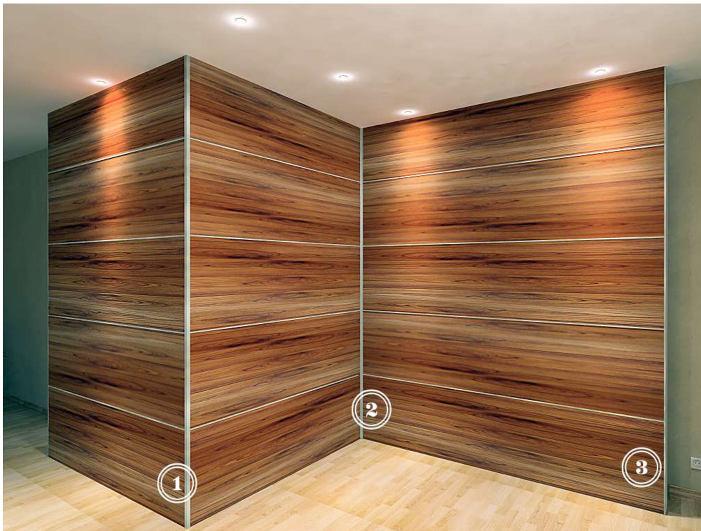
Система стеновых панелей с открытым профилем (стандарт)